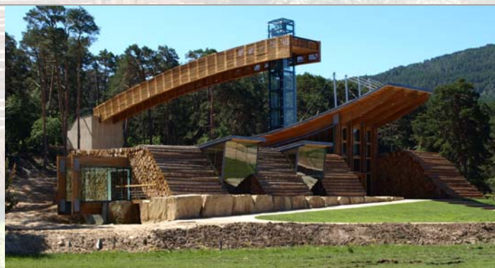
Obra premiada con el Premio de la Construcción Sostenible de Castilla y León 2008

Viniendo de Soria 60 km (45min.): Por la N234 dirección Burgos hasta la localidad de Abejar. Tomar la carretera CL-117 durante unos 33 km hasta llegar al cruce de Canicosa de la Sierra. Es a mano derecha (Km27,5 en la CL-117) o BU-P-8221.